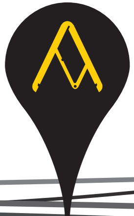
Paper Planes , Doshi & Levien Studio, Honorable Mention at the Compasso d'Oro, 2014