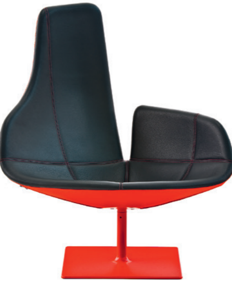
Fjord , Patricia Urquiola, Honorable Mention at the Compasso d'Oro, 2004