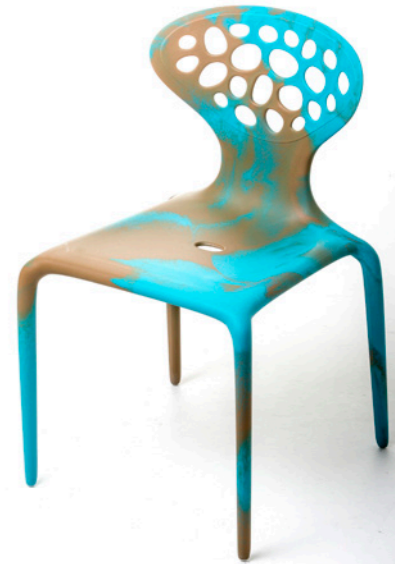
Supernatural , Ross Lovegrove, Honorable Mention at the Compasso d'Oro, 2008