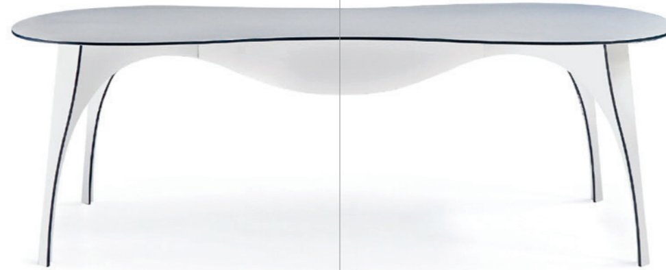
No Waste Table , Ron Arad, Honorable Mention at the Compasso d'Oro, 2008

ADI ADI ASSOCIAZIONE PER IL DISEGNO INDUSTRIALE DELEGAZIONE LOMBARDIA